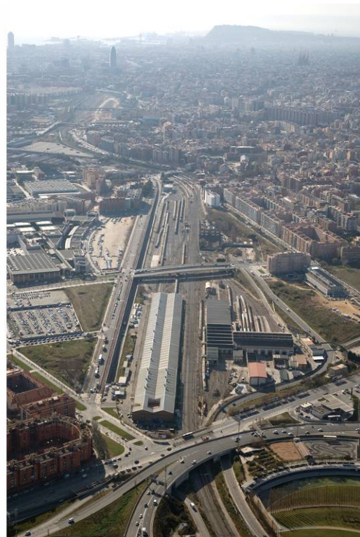
Vista de l'àmbit des del Nus de la Trinitat