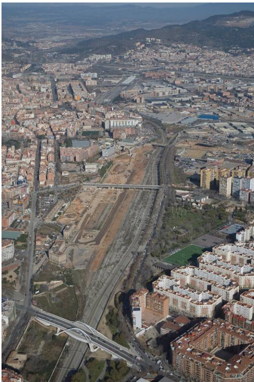
Vista de l'àmbit des del Pont de Bac de Roda

En aquest marc, s'acordà crear una societat per al desenvolupament de les actuacions a executar en l'àmbit Sant Andreu – Sagrera. La Societat es va constituir formalment el 27 de juny de 2003, davant notari.