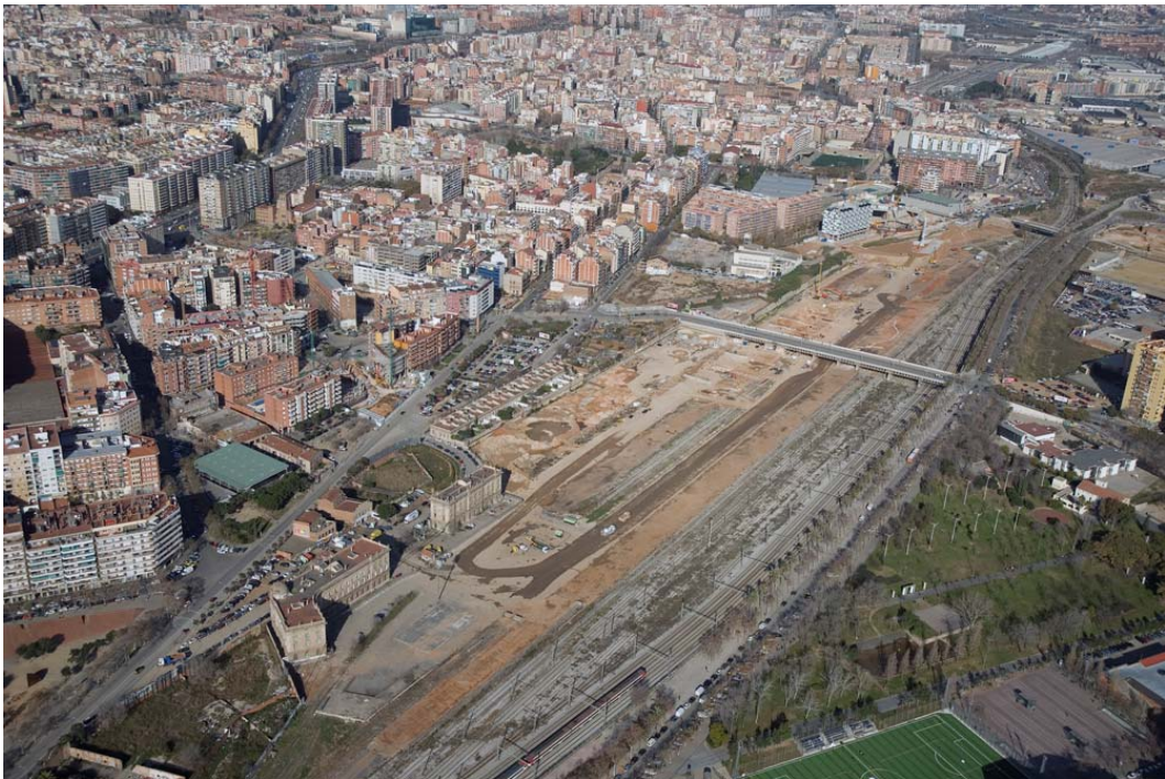
Vista aèria de l'àmbit de les instal·lacions de l'Estació de mercaderies una vegada enderrocades (gener 2008)

des des de la Dir ecc ió Ec on òmi ca i Fin anc era