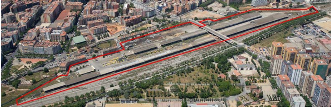
Vista aèria de l'àmbit de les instal·lacions de l'Estació de mercaderies abans d'ésser enderrocades

des des de la Dir ecc ió Ec on òmi ca i Fin anc era