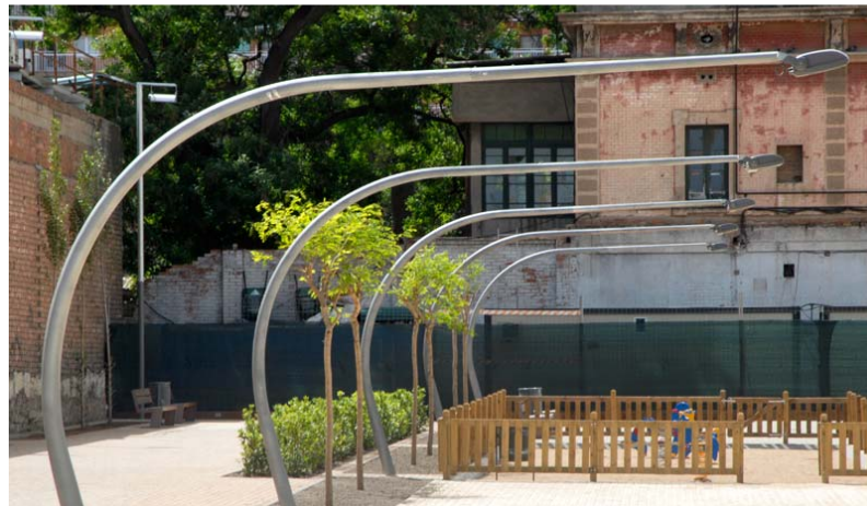
Fotografies de la urbanització de Can Portabella